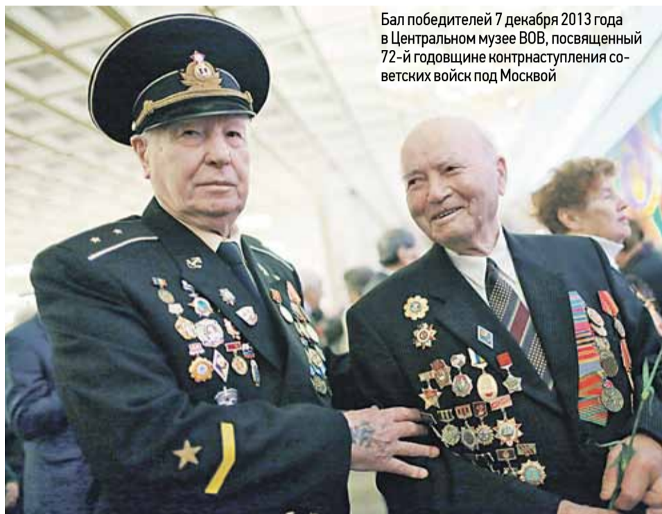
Бал победителей 7 декабря 2013 года в Центральном музее ВОВ, посвященный 72-й годовщине контрнаступления советских войск под Москвой